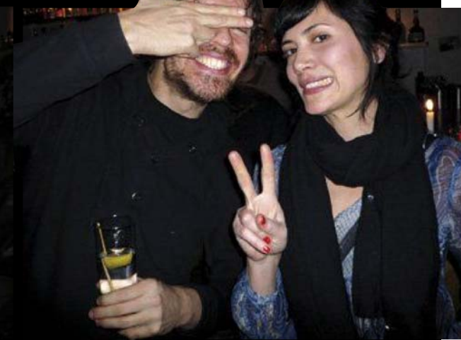
Multitalent Y.P. fürchtet sich vor Stalkern und möchte darum unerkannt bleiben, seine Begleiterin schiebt eine friedliche Kugel. Peace!